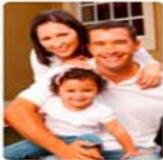
Derechohabientes, pensionados y