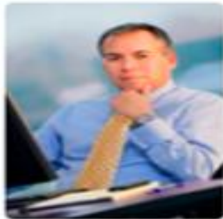
Patrones o Empresas