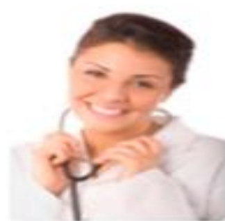
Profesionales de la salud