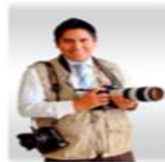
Sala de prensa