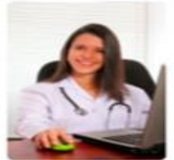
Salud en línea