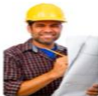
Proveedores del IMSS